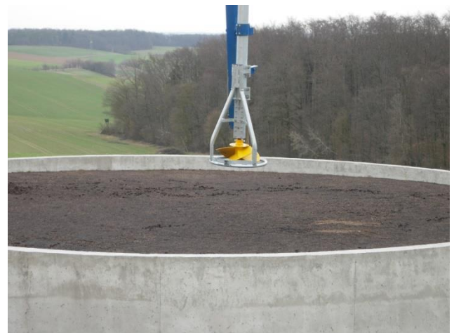
Güllebehälter mit \varnothing 10,8 m und 4 m Höhe (ca. 350m 3 ) Start 16:38Uhr