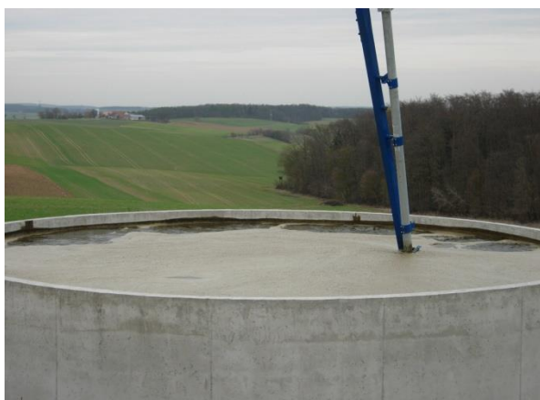
Ende 16:55 Uhr